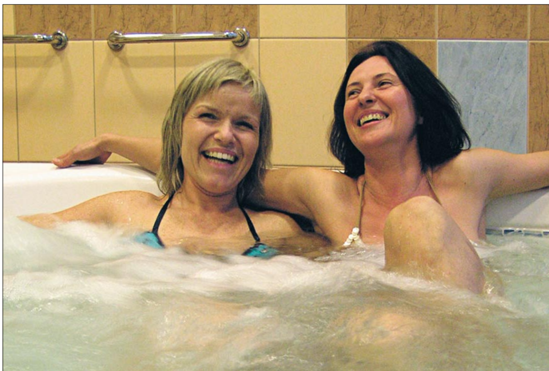
Nie musisz daleko szukać miejsca, aby skorzystać z dobrodziejstw filozofii „sanitas per aquam”. Wystarczy skorzystać z usytuowanego „tuż za rogiem” SPA i zanurzyć się w relaksie. Mały wodny raj w zasięgu ręki w Uzdrowisku Goczałkowice-Zdrój.

Jeszcze do niedawna do Uzdrowiska w Goczałkowicach przyjeżdżali głównie kuracjusze na długotrwałe leczenie sanatoryjne. Teraz coraz częściej zaglądają tu goście na godzinę lub nawet parę godzin dziennie, aby zażyć zdrowia i relaksu i zregenerować swo-